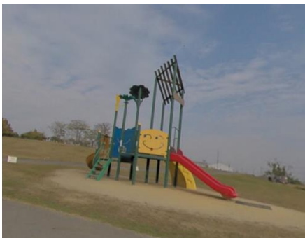
人口特徴物○で表記