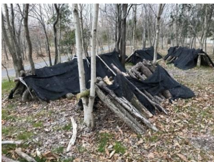
シイタケ床（通行禁止）