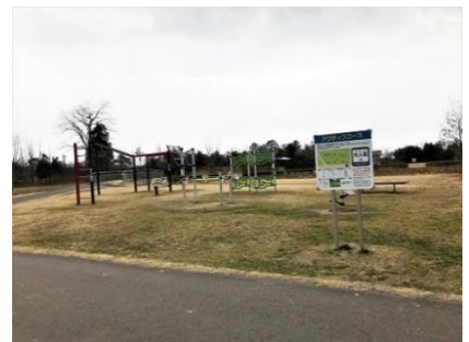
地図に記載していない遊具