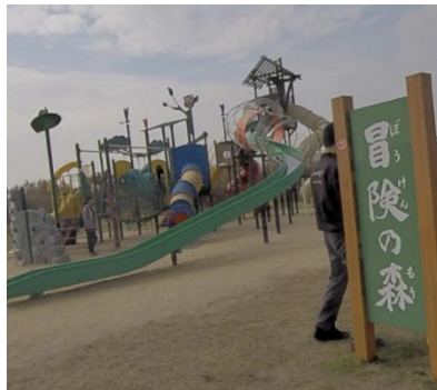
大型遊具、実寸で記入